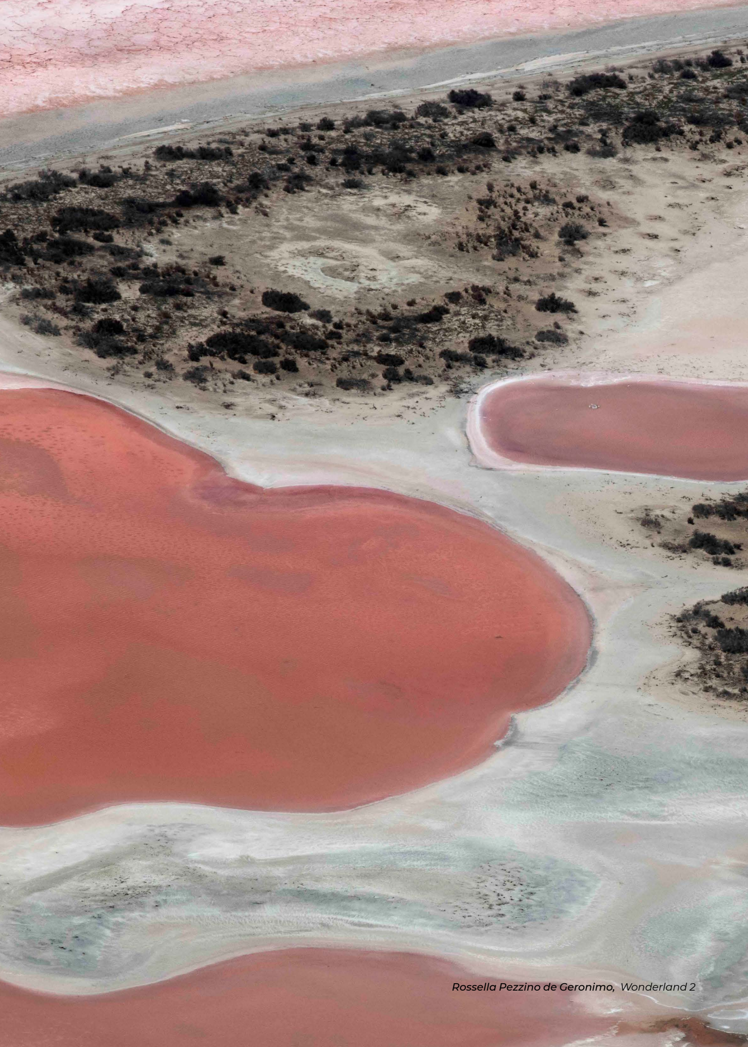
Rossella Pezzino de Geronimo, Wonderland 2