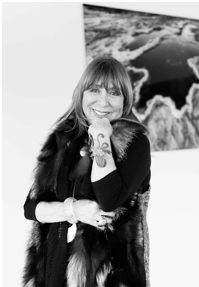
Uno scatto dell'artista Rossella Pezzino de Geronimo

Nel 2000 ricomincia a scattare foto. Organizza viaggi in tutto il mondo, Birmania, India, vive con le tribù dei luoghi che visita.